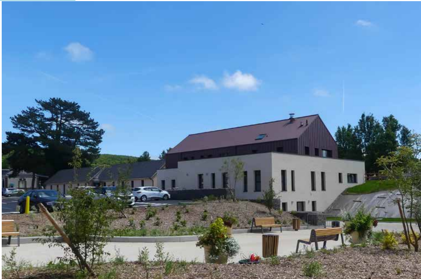
▲ Le Pôle de Santé vu depuis la route de Barville

« Le conseil municipal tient à remercier les Canycais.es pour leur patience. »