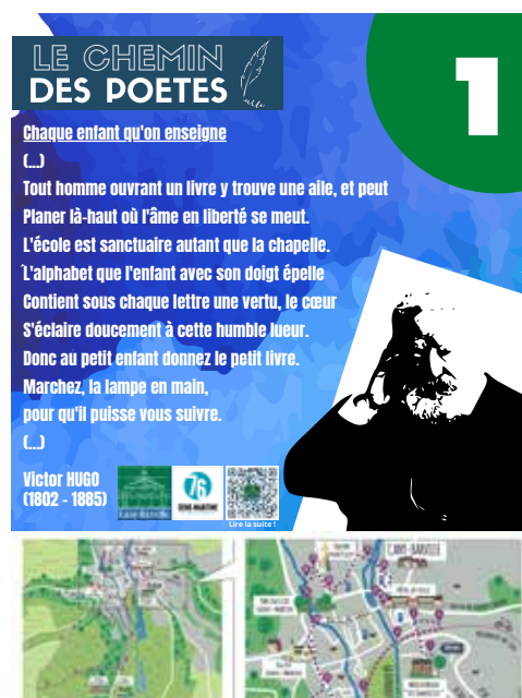
► Un exemple de panneau du « Chemin des Poètes »

« un circuit d'environ 4 kms permettant de visiter Cany-Barville d'une manière originale »