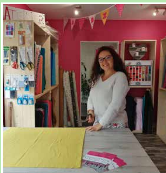
NOUVEAU Bobines et Cousettes Mercerie - Atelier de couture 5 rue du Général de GAULLE 02.27.13.98.17

Au total, 2547 km ont été parcourus par les coureurs et les marcheurs. Il faut ajouter à ces chiffres les performances de nombreux participants qui ont suivi librement les deux parcours sans transmettre leurs résultats. Bravo à l'équipe du challenge Caux-vite 2021 pour cette belle initiative.