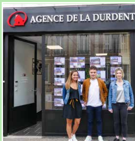
NOUVEAU L'agence de la Durdent Agence immobilière 20 rue du General de GAULLE 02.27.13.13.72